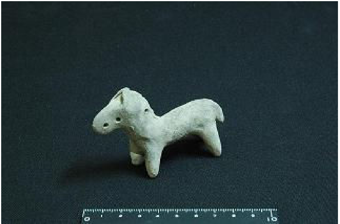
写真3 ガーネム・アル・アリ遺跡から出土したテラコッタ（ウマ）