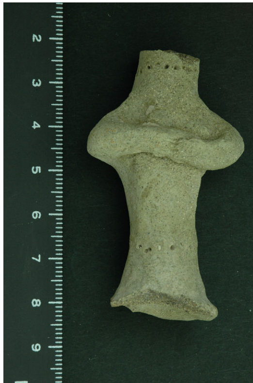
写真6 ガーネム・アル・アリ遺跡から出土したテラコッタ（女性像）