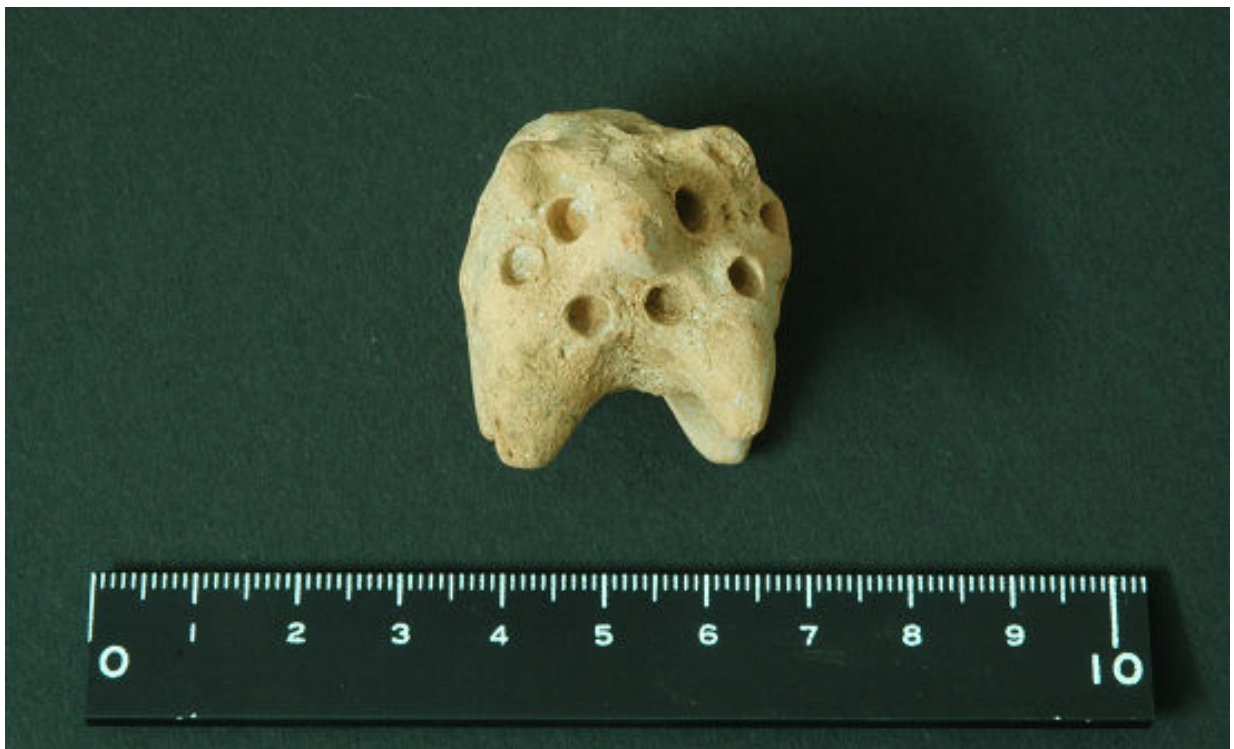
写真5 ガーネム・アル・アリ遺跡から出土したテラコッタ (ブタ)