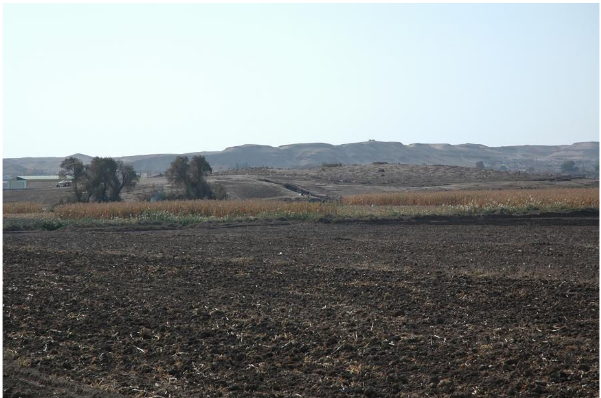
写真1 ガーネム・アル・アリ遺跡の発掘風景