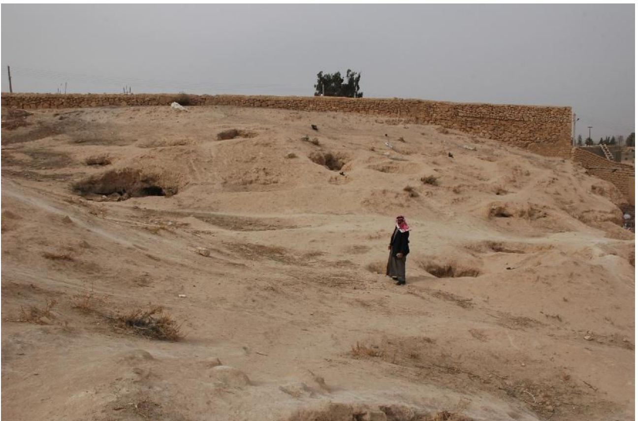
写真7 ガーネム・アル・アリ遺跡直近の墓群