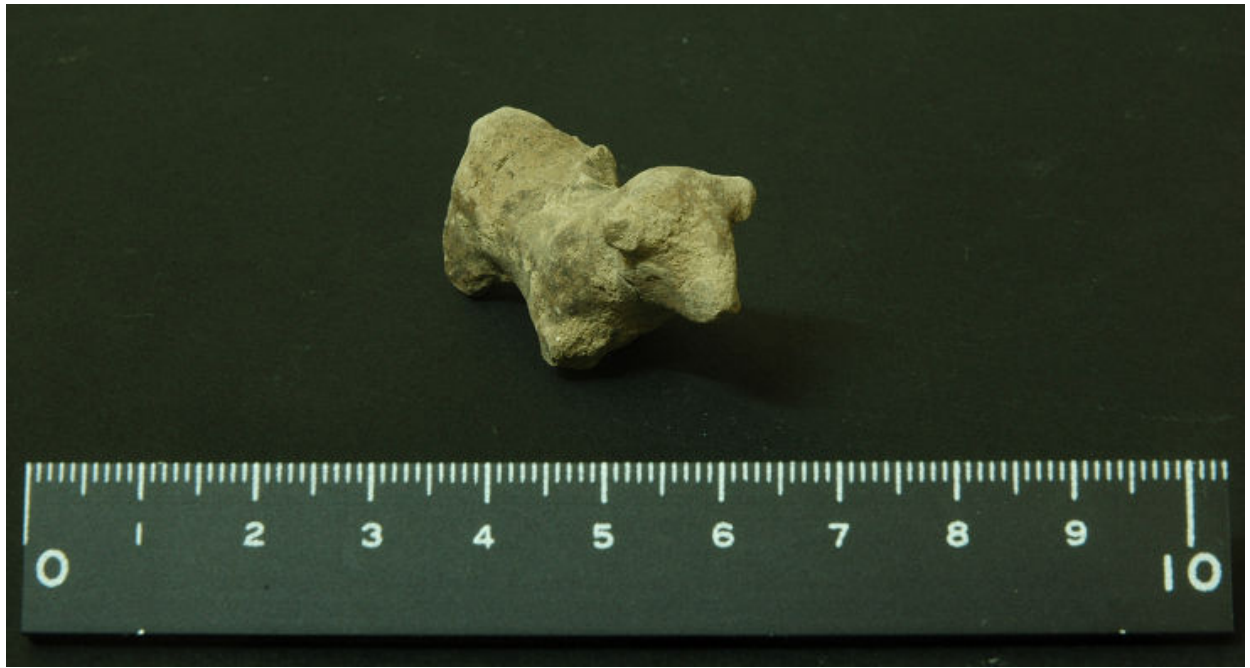
写真4 ガーネム・アル・アリ遺跡から出土したテラコッタ (クマ)