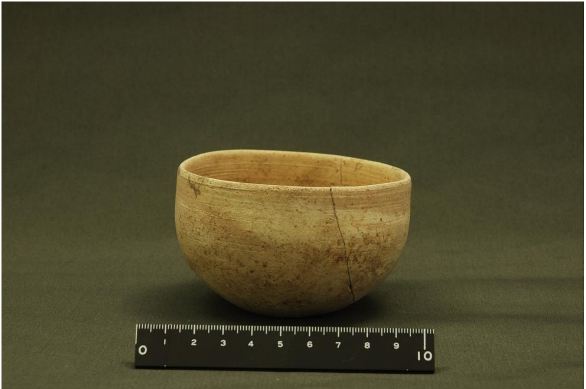
写真2 ガーネム・アル・アリ遺跡から出土した土器